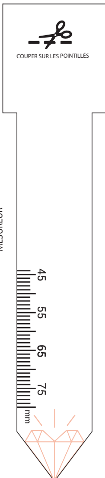
Tableau d'équivalences Taille/mm: